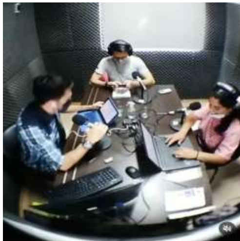
216 reproducciones • Le gusta a rociobarroso