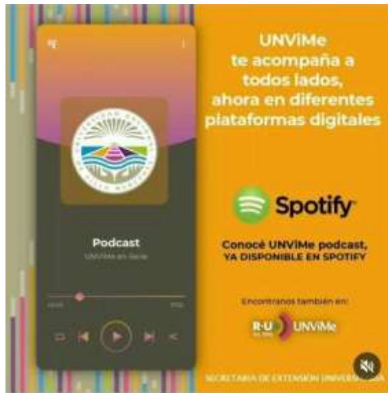
286 reproducciones • Le gusta a elviraelidaquiroya unvime_insta Con la intención de seguir desarrollando producciones de la universidad en nuevas platafo... más