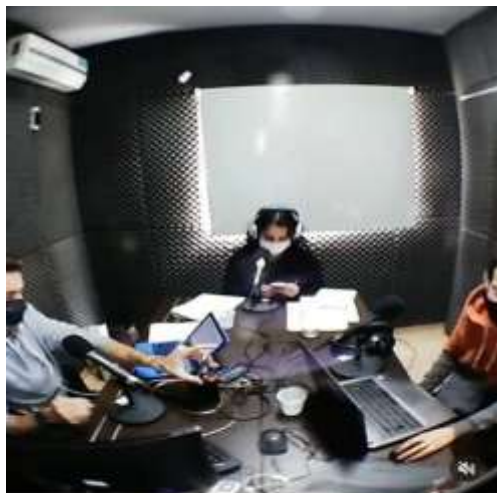
288 reproducciones • Le gusta a catalinabruja1953

Recuperación de algunas capturas de todas las actividades realizadas durante el periodo 2020 desde la Escuela de Gestión de Empresas y Economía.