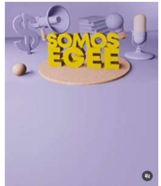
Instagram post showing engagement icons (heart, comment, share, bookmark).